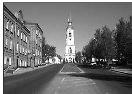
Центр города Сарова. Колокольня — единственное строение, оставшееся от разрушенного Саровского монастыря.

Вспомнился юбилей института, который начали праздновать на стадионе. Весёлые ребята, украшенные розгами и хвостиками, катили по дорожке платформу, а на ней стоял большой буфаторский котёл, в котором с комфортом устроились заслуженных ветерана института. День был жарким, ветераны сидели голые по пояс, держали в руках кружки с пенным пивом и, отхлебывая его, весело посматривали на своих коллег, сидевших на трибунах. Возле котла стоял главный чёрт с трезубцем в руках, а рядом вертелась две «ведьмочки» в купальниках, с распущенными волосами, каждая