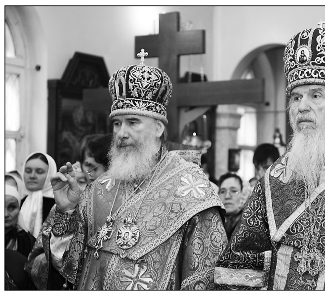
Также была освящена часовня в честь Иверской иконы Божьей Матери, созданная при храме и расположенная в основании построенной рядом с храмом колокольни. В ней теперь будет находиться Иверская икона Божьей Матери, привезённая осенью 2009 года со Святой Горы Афон. Она была приобретена и освящена в Иверском монастыре Святой Горы Афон и побывала на том самом месте, куда когда-то, во времена иконоборчества, по морю приплыла сама Иверская икона, которая по сей день находится в Иверском монастыре. Икону также называют Вратарница. И сколько отрады, сколько надежды для нас с вами в этом наименовании! «Радуйся, благая Вратарнице, двери райские верным отверзающая»...