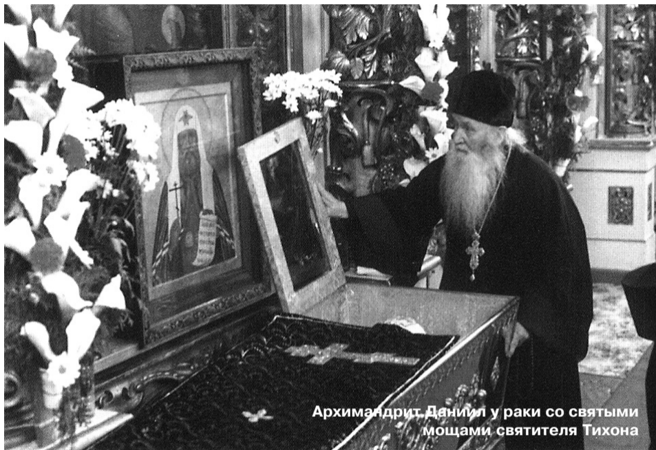
Архимандрит Даниил у раки со святыми мощами святителя Тихона

В юности архимандриту Даниилу посчастливилось получить благословение святейшего Патриарха Тихона. Он удостоился проводить в последний путь святителя, ему суждено было дожить и до его прославления.