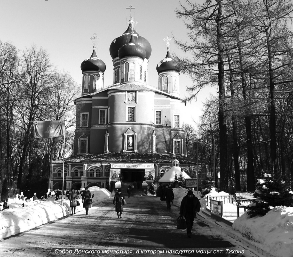
Собор Донского монастыря, в котором находятся мощи свт. Тихона

в монастыре за старшего. Забот было не особенно много, если бы не досадный конфликт с какими-то странными людьми, свалившимися на наши головы. Они представлялись священниками и мирянами Русской Зарубежной Церкви, хотя никакого отношения к ней, как впоследствии выяснилось, не имели. Со скандалом и безчинствами они во что бы то ни стало пытались устроить в монастыре свои богослужения без благословения Патриарха. Мы уговаривали, увещевали их как могли и наконец, поняв, что ничто не помогает, решительно выставили незваных гостей за ограду. Но те затаили злобу.